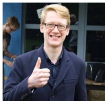
Sigi: Gaat winnen